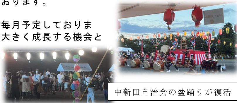
中新田自治会の盆踊りが復活