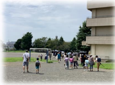
登録された引き渡し人のみに引き渡し