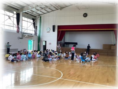
学童所属児童は学童へ引き渡し